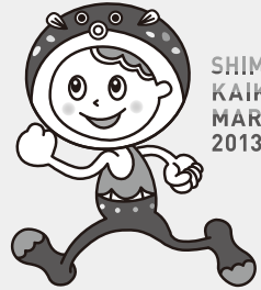
SHIMONOSEKI KAIKYO MARATHON 2013

下関海響マラソンの知名度の向上とイメージアップを図るため、キャンペーンや大会記念グッズ・着ぐるみ等にも活用でき、広く愛され、親しまれるスポーティーな下関海響マラソン「イメージキャラクター」を作成しました。